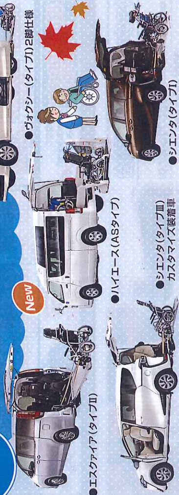
●エスクアア (タイプII)

車両後部に備えたスロープやリフトを使って、車いすのまま乗り降りできます。遠隔などの短い距離の移動が多い方や福祉施設などの送迎用としてもご使用いただけます。