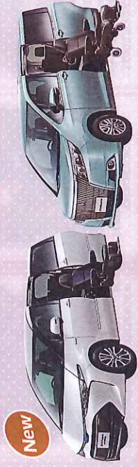
●エスクアアHV (装着車)

セカンドシートが電動で回転し、車外へスライドアウトして、車いすからの乗り降りをサポートします。脱着可能なシートのタイプもあります。ご家族でお出かけしたい方、後席にゆとり乗りたい方におすすです。