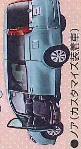
●ノア (カスタマイズ装着車)