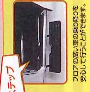
フロアの低い車の乗り降りを安心して行うことができます。