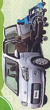
●ボルテ 脱着シート<手動式>+専用車いす仕様

脱着可能なシートまたは専用車いすのまま、助手席へ乗り降りすることが可能です。お出かけする用途に合わせてタイプが選べいただけます。