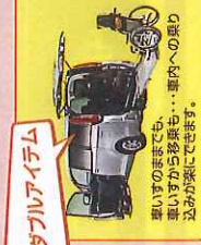
ダブルエアシーム